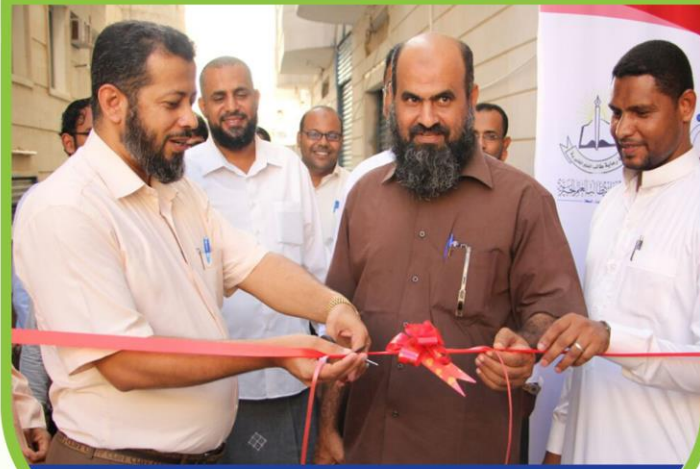
افتتاح مركز الرائد للطلاب الجامعيين بمحافظة عدن