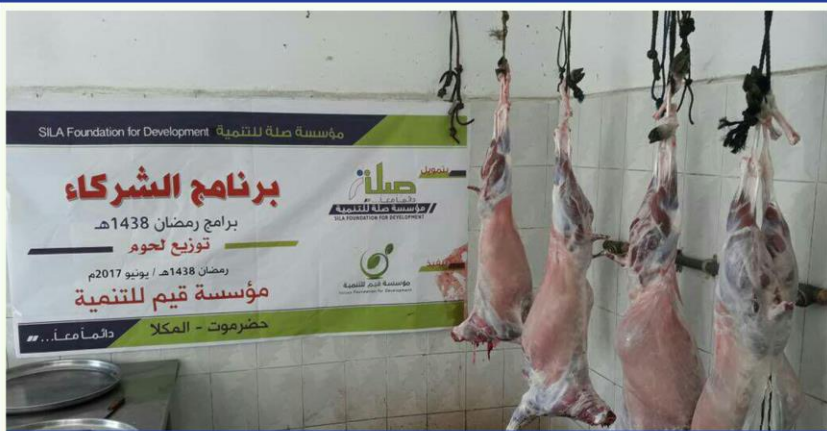
برنامج توزيع اللحوم - محافظة حضرموت