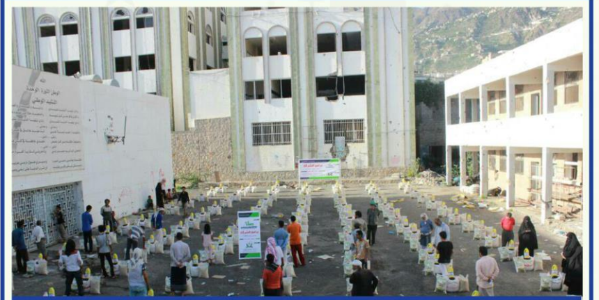
توزيع السلة الغذائية - محافظة تعز