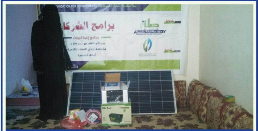
توزيع ألواح الطاقة الشمسية للأسرة المحتاجة - صنعاء