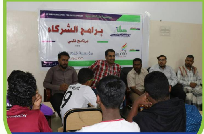
تدشين برنامج قلبي لمحو الأمية لدى الشباب