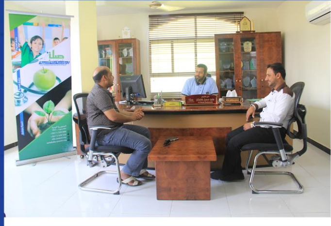
زيارة مدير عام مكتب الصحة العامة والسكان بساحل حضرموت