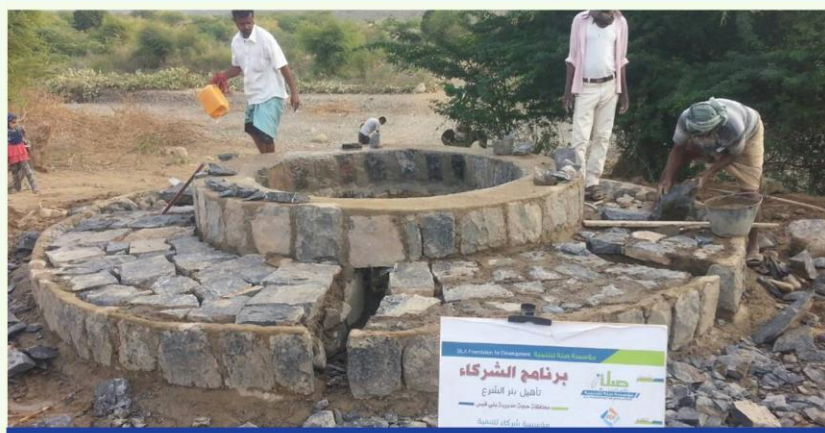
إعادة تأهيل بئر الشرع بمحافظة حجة