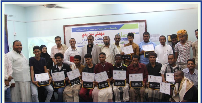
اختتام إحدى دورات برنامج مهنتي بين يدي وحصول المتدربين على شهادة تدريب - حضرموت