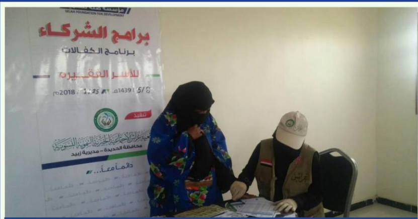
توزيع الكفالات النقدية للأسر الفقيرة والأرامل والأيتام - الحديدة