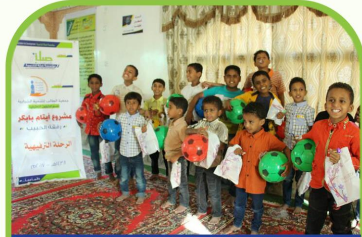
برنامج رفقة الحبيب ( أيتام بابكر )