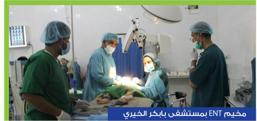
مخيم ENT بمستشفى بابكر الخيري