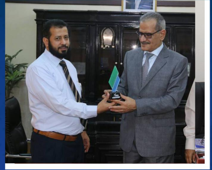
مع معالي وزير التربية والتعليم اليمني الدكتور : عبدالله لملمس