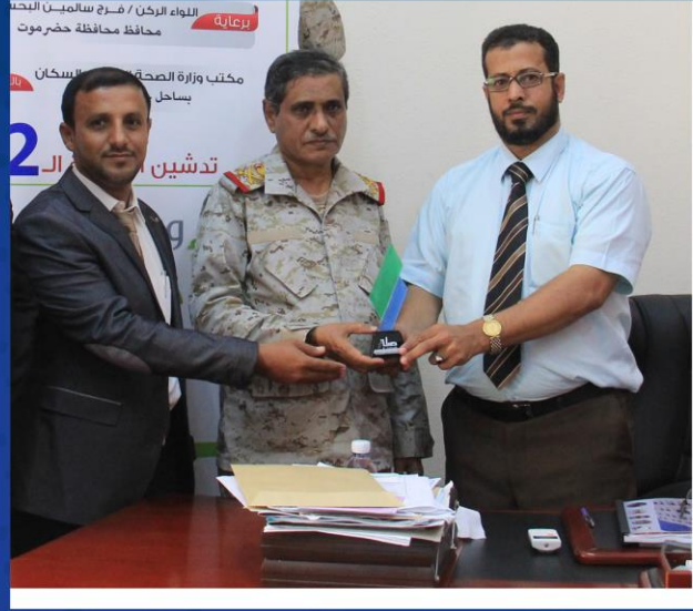
مع سيادة اللواء الركن : فرج سالمين البحسني محافظ محافظة حضرموت