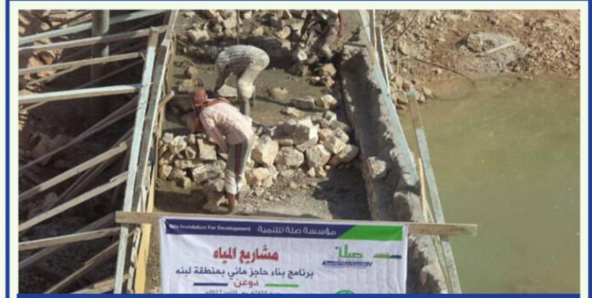
بناء حاجز مائي بمنطقة لبنه - دوعن