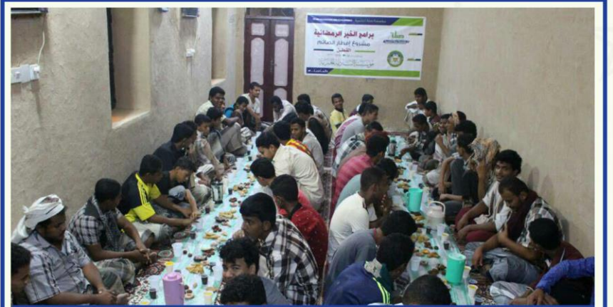
برنامج إفطار الصائم - محافظة حضرموت