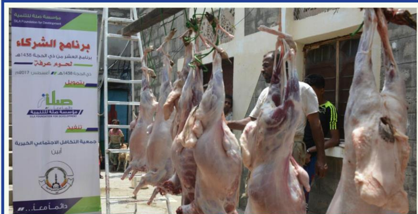
توزيع لحوم يوم عرفة لإدخال السرور على الاسر الفقيرة - محافظة أبين

وهو توزيع اعانات نقدية خلال أيام العشر الأولى من ذي الحجة للمحتاجين والفقراء .