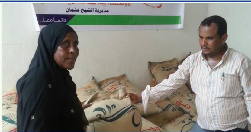
توزيع الأرز عبوة 40 كيلو للأسر الفقيرة والمحتاجة - عدن