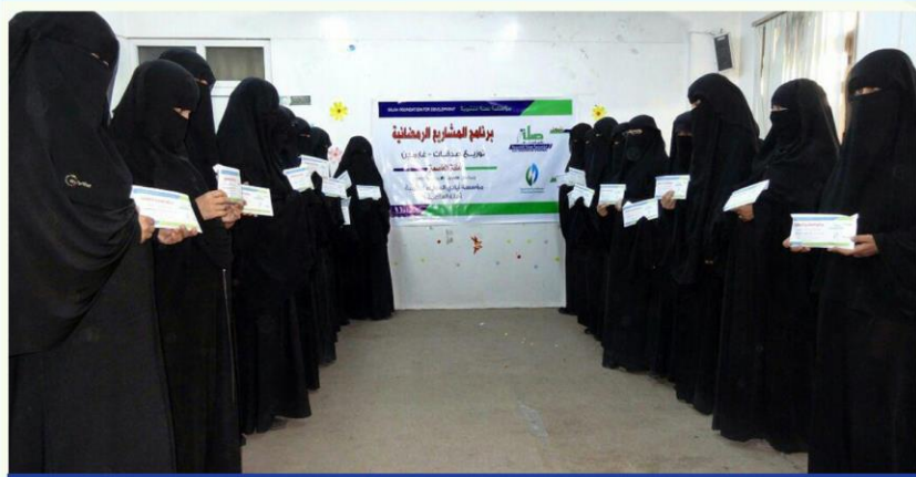
برنامج الصدقات النقدية - محافظة صنعاء