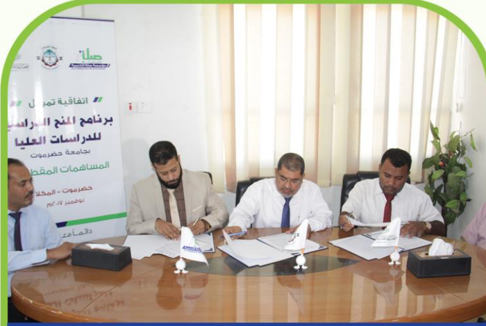
توقيع اتفاقية برنامج المنح الدراسية مع جامعة حضرموت - المكلا