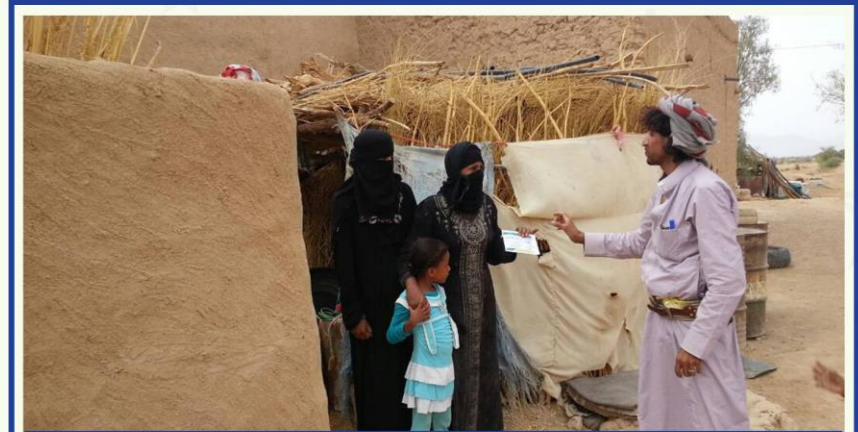
أسرة فقيرة تستلم إعانة نقدية - محافظة حجة